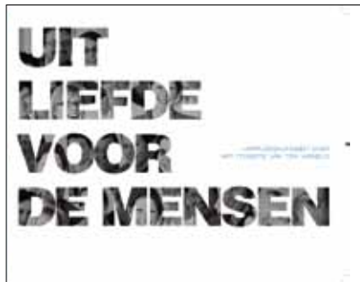
Uit liefde voor de mensen. Verpleegkundigen over het mooiste vak ter wereld , Regionaal Ziekenhuis Sint-Maria Halle, 2010. Gratis te downloaden op www.sintmaria.be

Verpleegkundige is een knelpuntberoep. Elk ziekenhuis heeft het moeilijk om goede, gekwalificeerde mensen te vinden. Nochtans is het een prachtig beroep. Het Regionaal Ziekenhuis Sint-Maria Halle brengt in een veertigtal getuigenissen hulde aan de verpleegkundige.