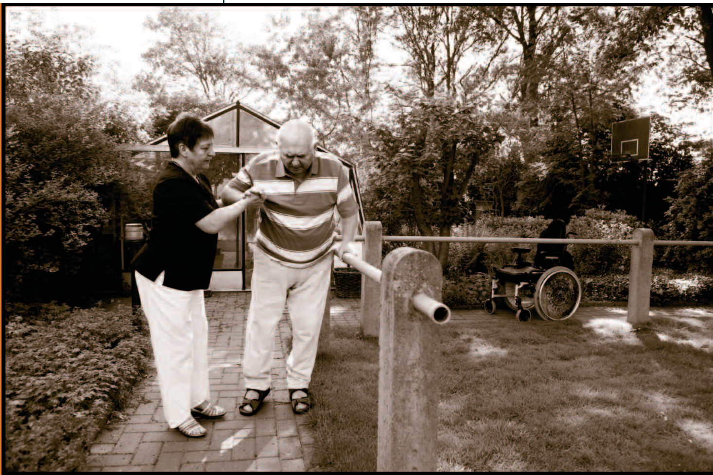
Geavanceerde looprekjes en rolstoelen worden nog veel te weinig gebruikt in Vlaanderen.