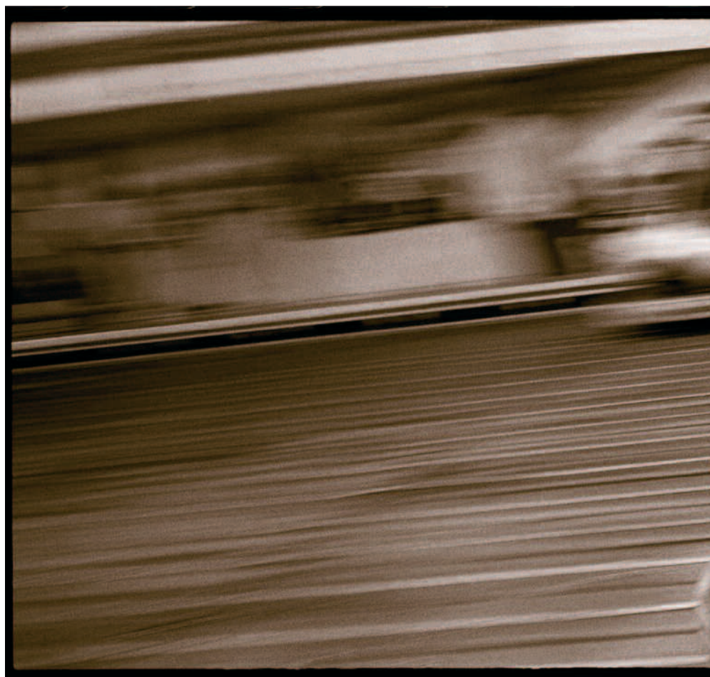
De Marokkaanse vaders hebben uiteindelijk het belang van vrijetijdsactiviteiten ingezien.