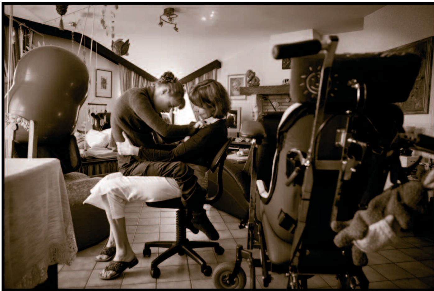
Mantelzorg komt meer onder de aandacht nu vrouwen een loopbaan hebben.