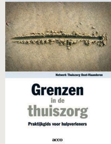
Grenzen in de thuiszorg. Praktijkids voor hulpverleners , ACCO, 2010, 128 p., €22,50. ISBN 978 90 334 7921 2

De thuiszorgsector is de laatste jaren onderhevig aan een sterke groei en ingrijpende veranderingen. Grenzen in de thuiszorg is een praktijkboek voor alle veldwerkers die in hun dagelijkse werk met thuiszorg te maken krijgen.