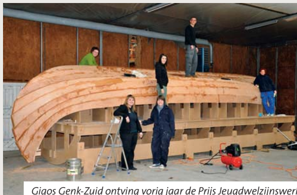
Gigos Genk-Zuid ontving vorig jaar de Prijs Jeugdwelzijnswerk.

► Voor meer info, het reglement en het kandidaatsformulier: www.uitdemarge.be