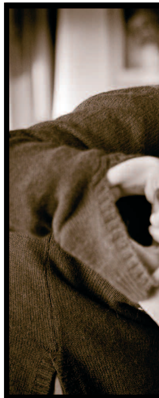
Mantelzorg is als begrip pas verspreid geraakt in de

Jacobs: "Wij gebruiken de term wanneer mensen die wegens ziekte, handicap of ouderdom niet in staat zijn gewone dagelijkse activiteiten uit te voeren, hulp krijgen van gezinsleden, familieleden, vrienden, burens of kennissen. Wanneer we onderzoeken hoeveel mantelzorgers er in